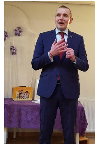
Frá útgáfugleðinni. Að ofan: Hr. Guðni Th. Jóhannesson forseti Ísland. Að neðan: Ásmundur Einar Daðason félags- og barnamálaráðherra.

Pöntun á öllu námsefni Vinátta fer fram í gegnum sérstaka pöntunarsíðu sem er hér .