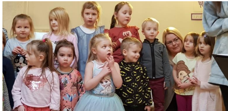
Börn úr leikskólanum Fífuborg sungu nokkur Vináttulög í útgáfugleði Vinátta fyrir 0-3ja ára

Óhætt er að segja að mikil eftirvænting var ríkjandi á meðal kennara að fá námsefnið í skólana og hafa rúmlega 300 kennarar sótt námskeið í notkun efnisins. Nánari upplýsingar um efnið fyrir 0-3ja ára má nálgast hér .